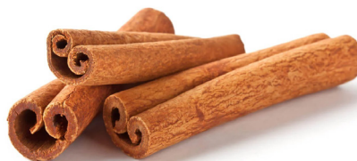
Canela en rama